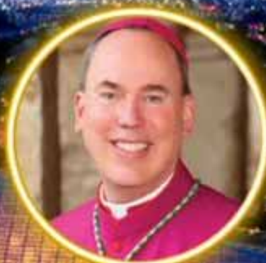
OBISPO TIMOTHY FREYER